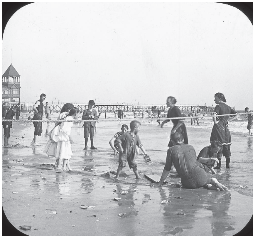
New York State Archives